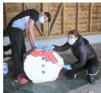
Chantiers Jeunes ☺

Pour le volet « vie associative », la commission travaille pour coordonner les animations associatives dans le village. Chaque fin d'année, elle élabore un calendrier des manifestations afin que chaque association puisse bénéficier des salles communales. Elle aide les associations à rendre le village dynamique et attrayant (offres sportives, festives, culturelles...) et apporte son concours matériel et logistique lors des manifestations.