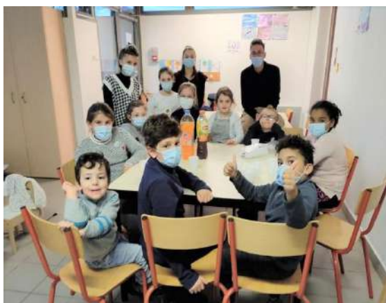
☺ Accueil périscolaire

Exemple de deux actions organisées par la CCLS en coordination avec la commune :