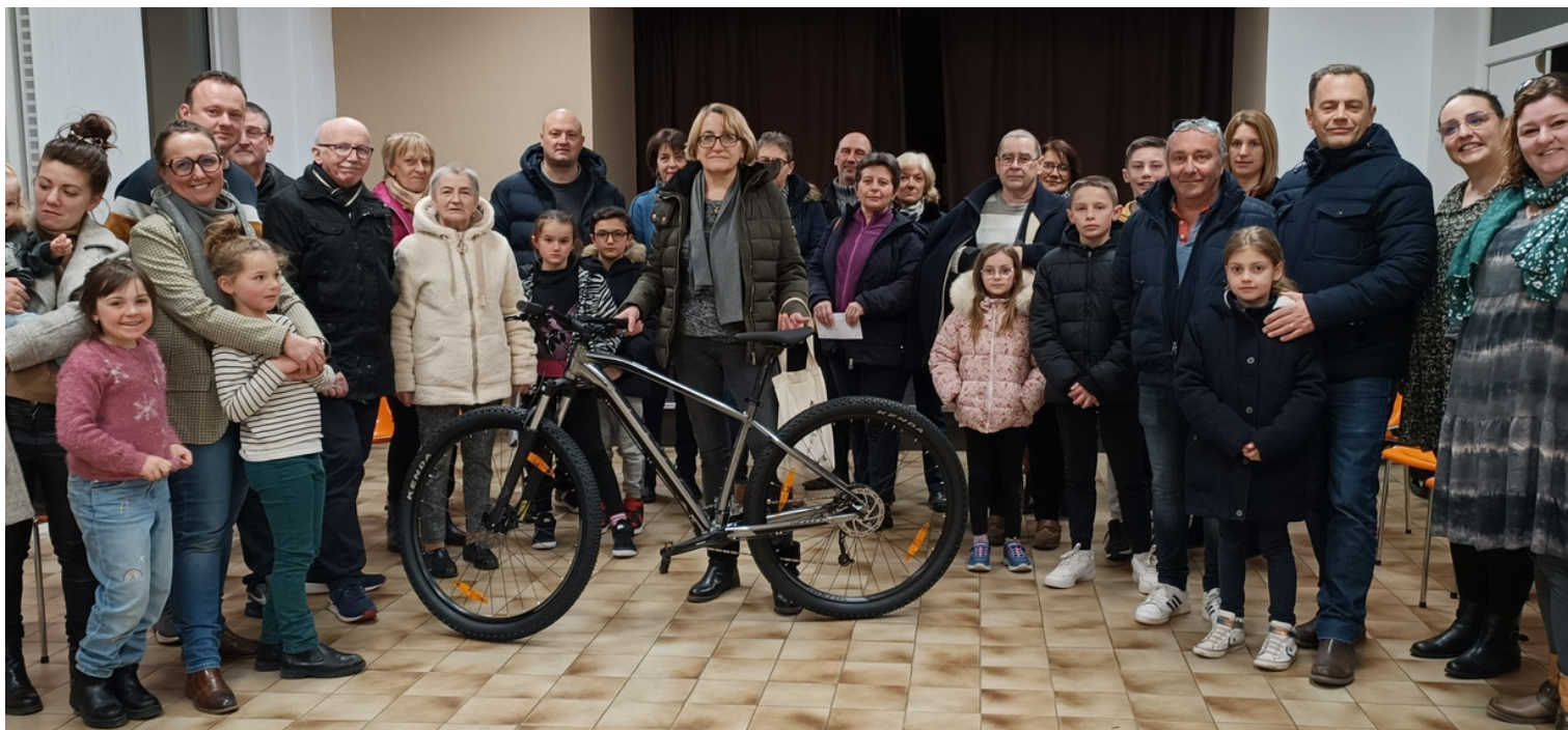
Remise des prix de la tombola de 100% St Did, l'association des commerçants et des artisans désidétiens